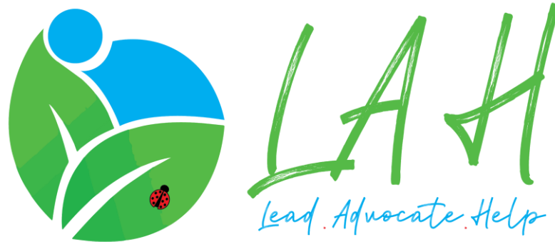
Logo rasmi Projek LAH 2020/2021